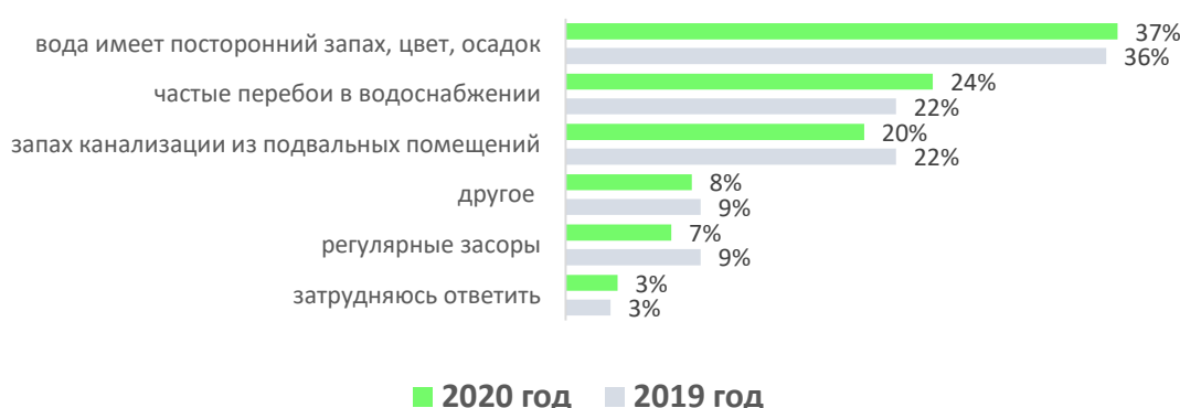
Причины неудовлетворенности респондентов качеством предоставляемых услуг водоснабжения и водоотведения, %

В ходе проведения анализа комментариев, оставленных респондентами значительная часть респондентов, выявлено, что чаще всего недовольство жителей вызывает плохое качество и недостаточный напор воды. Далее представлены комментарии пользователей с распределением по муниципальным образованиям Сахалинской области.