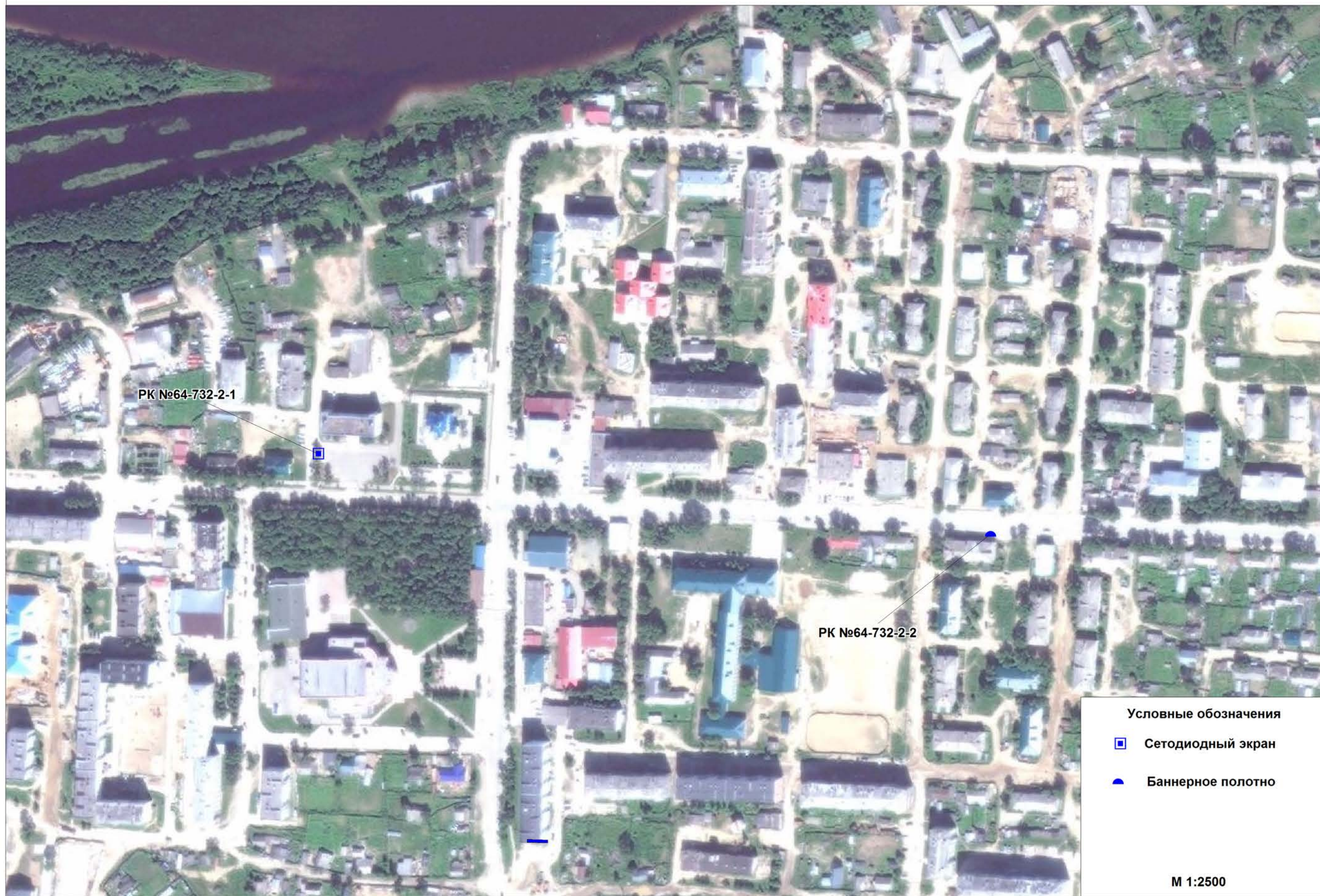
Схема размещения рекламных конструкций на территории муниципального образования "Городской округ Ногликский"