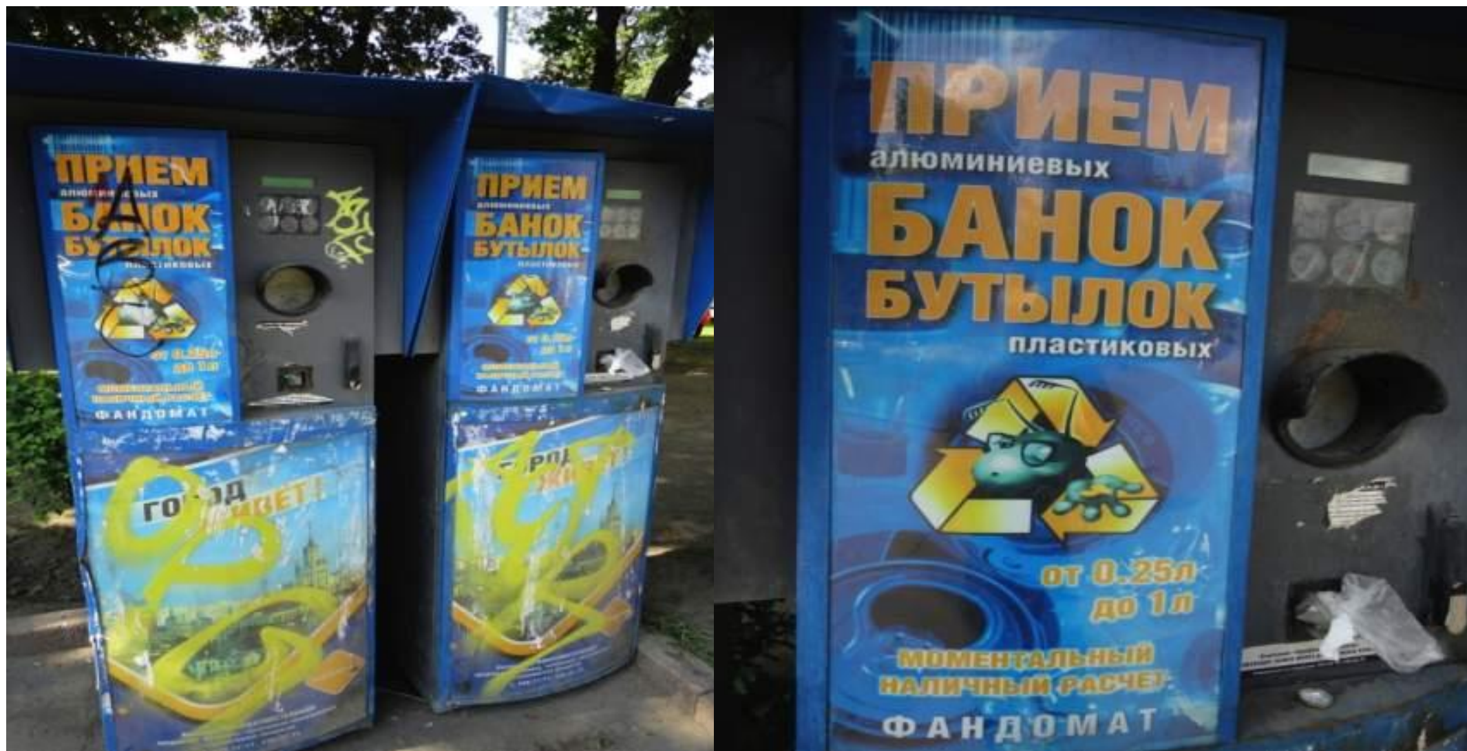
Машины для алюминиевых банок