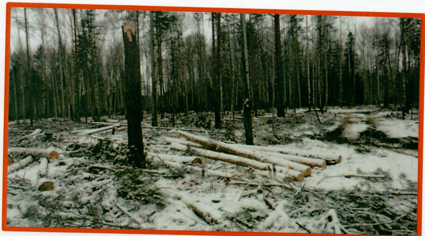
Изображение № 7 Брошенная древесина вдоль лесовозных дорог. Не является валежником