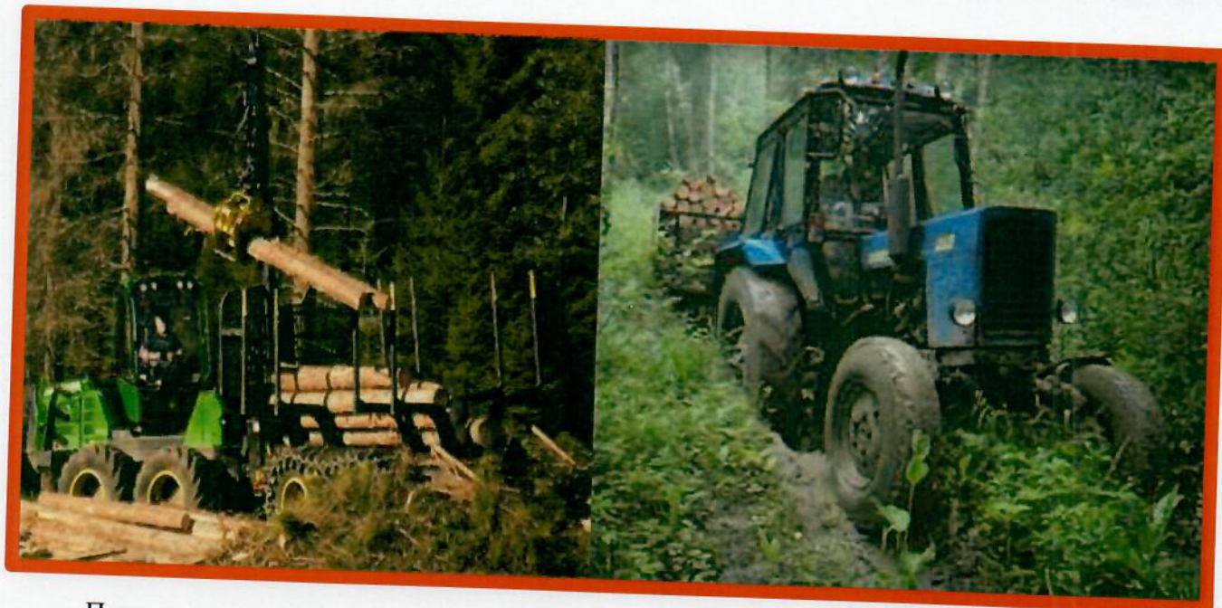
Изображение № 9 Специализированная техника. Использование для заготовки валежника запрещено

При заготовке валежника не допускается повреждение почвенного покрова, подроста и молодняка ценных пород, лесных культур.