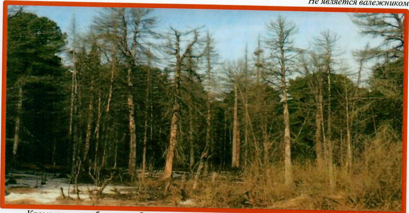
Изображение № 4 Сухостойное дерево. Не является валежником

Кроме того, необходимо обратить внимание, что деревья, которые лежат на земле, но не имеют признаков естественного отмирания (имеют зеленую листву или хвою), определять как «мертвые» не допускается (смотри изображение № 5).