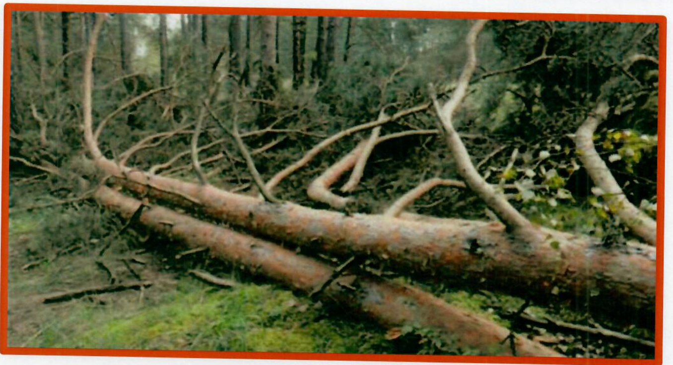
Изображение № 5 Лежащее на поверхности земли ветровальное дерево, не имеющее признаков отмирания. Не является валежником

Ветровальные деревья (вывернутые с корневищем) не являются мертвыми деревьями, хотя они лежат на земле, но могут продолжать жить, расти и даже давать потомство (вегетативное).